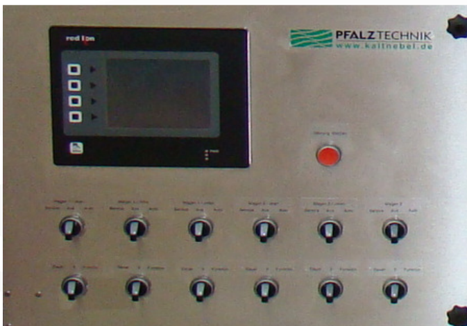
Elektrische Steuerung mit Datenlogger

Die elektrische Anlagensteuerung erfolgt über einen zentralen Steuerschrank, der über trennbare Anschlüsse die Medien zu den Düsen führt. Damit ist das Umsetzen der Befeuchtungsanlage sowie eine einfache Demontage zu Wartungszwecken in Kürze gewährleistet.